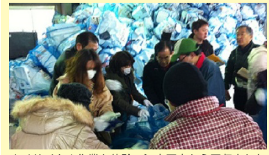
▲リサイクル作業を体験。江東区内から回収された発泡トレイが再資源化されるまでを見学します。