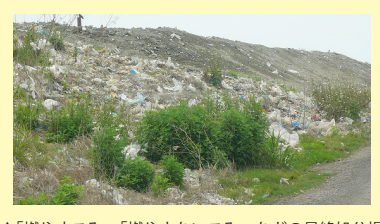
▲「燃やすごみ」「燃やさないごみ」などの最終処分場の様子。東京湾に接する埋立地の中を見学します。